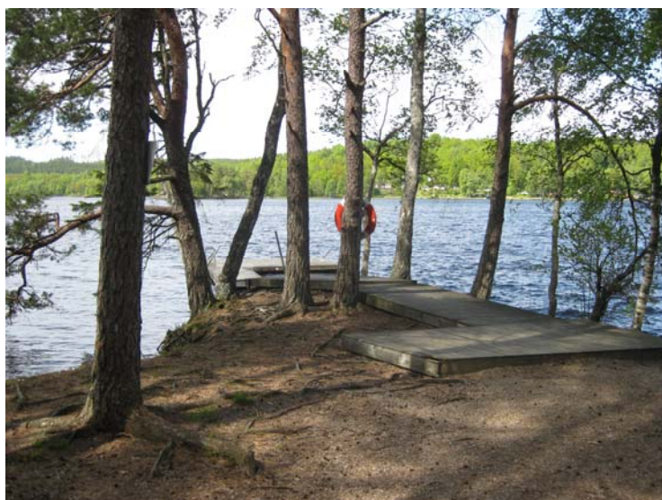
der eigene Lagersteg