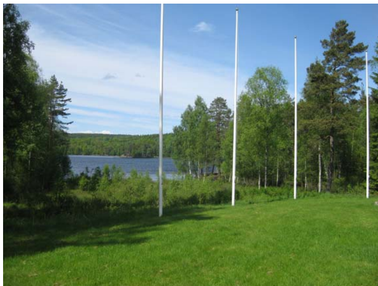
(der zentrale Platz)

Nach dem Lager werden wir als Kontingent dann gemeinsam zum Jamboree (ca. 250km) Entfernung reisen.